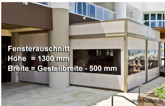
Senkrechtmarkise mit kristallklarer Durchsicht weitere Infos unter www.le-service.de